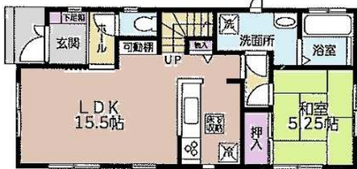
1F:52.99m 2 (16.02坪)