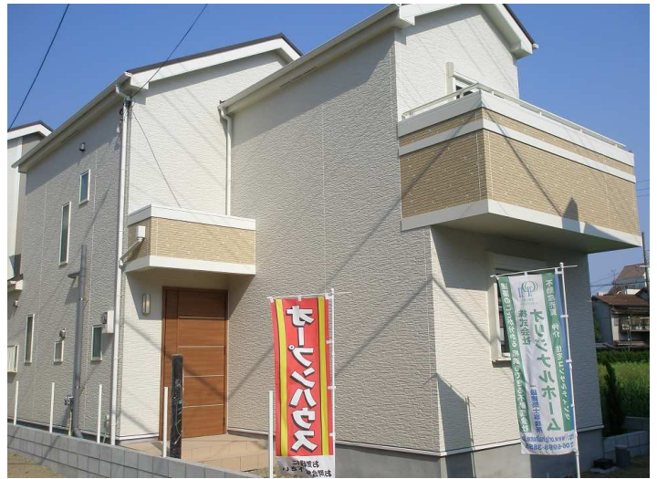
平成28年5月22日写真撮影